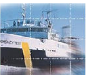
Materie prime chimiche di base