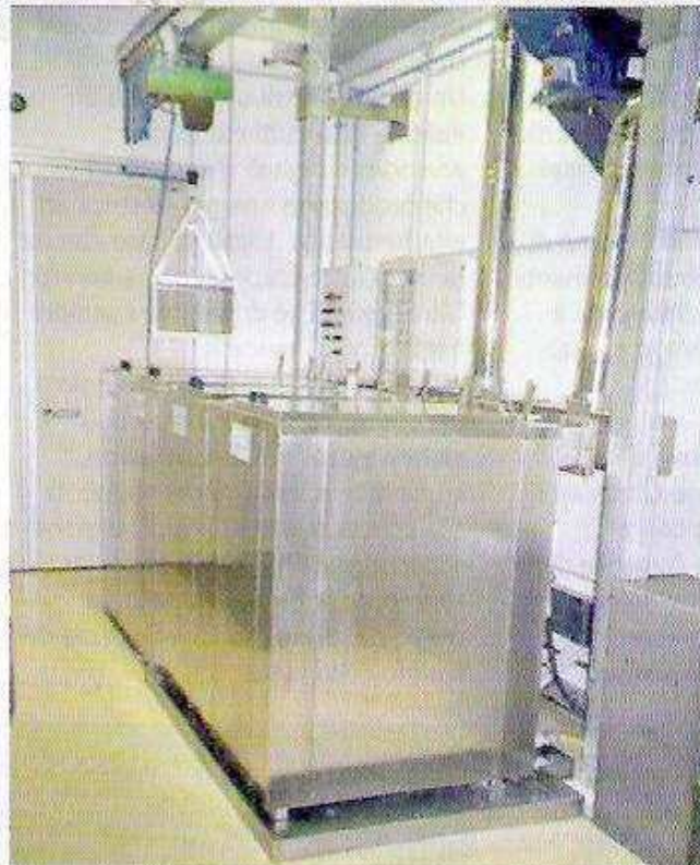
Impianto di lavaggio con detergente, risciacquo idrocinetico, protezione e asciugatura stampi.

Le macchine a ultrasuoni per il lavaggio stampi sostituiscono tutti gli impieghi con solventi o con prodotti chimici aggressivi, per questo sono altamente ecologiche e sicure".